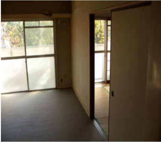
1 居間・個室(1)間仕切り